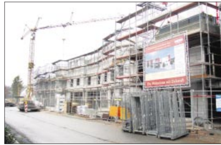
Baustelle „Service Wohnen Traisa“ in der Jahnstraße.

Günter Mielke, Langstreckenläufer, Olympiateilnehmer 1972 München, 10 000 Meter 1976 in